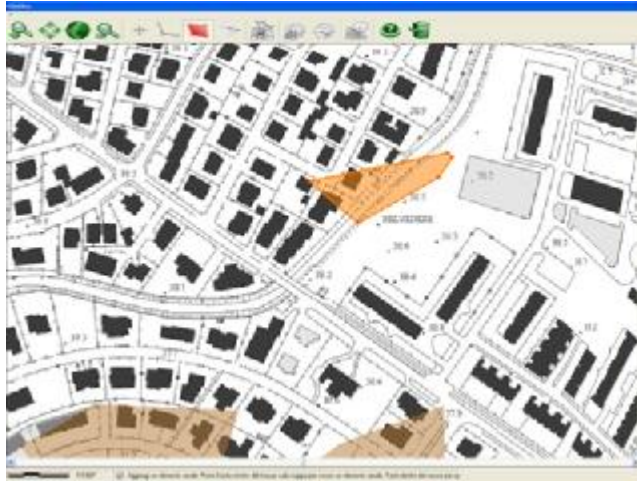
Figura 2: schermata di lavoro dell'applicativo GeoArc